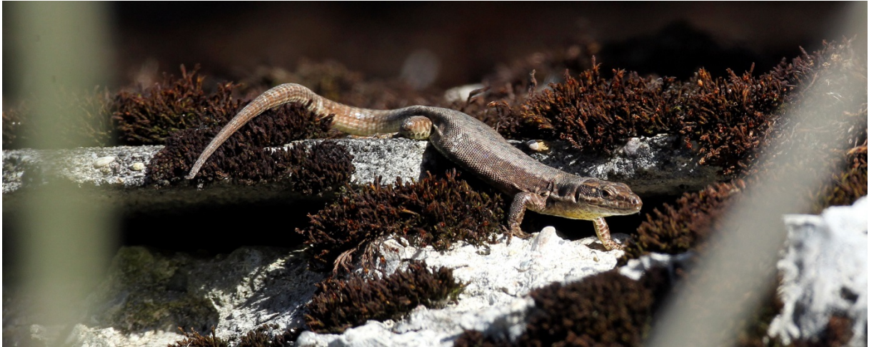
Abb. 3 und 4: beide beobachteten Exemplare der Mauereidechse.