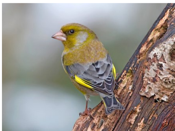
Grünfinkenmännchen verraten sich während der Balz durch rollende Rufe.