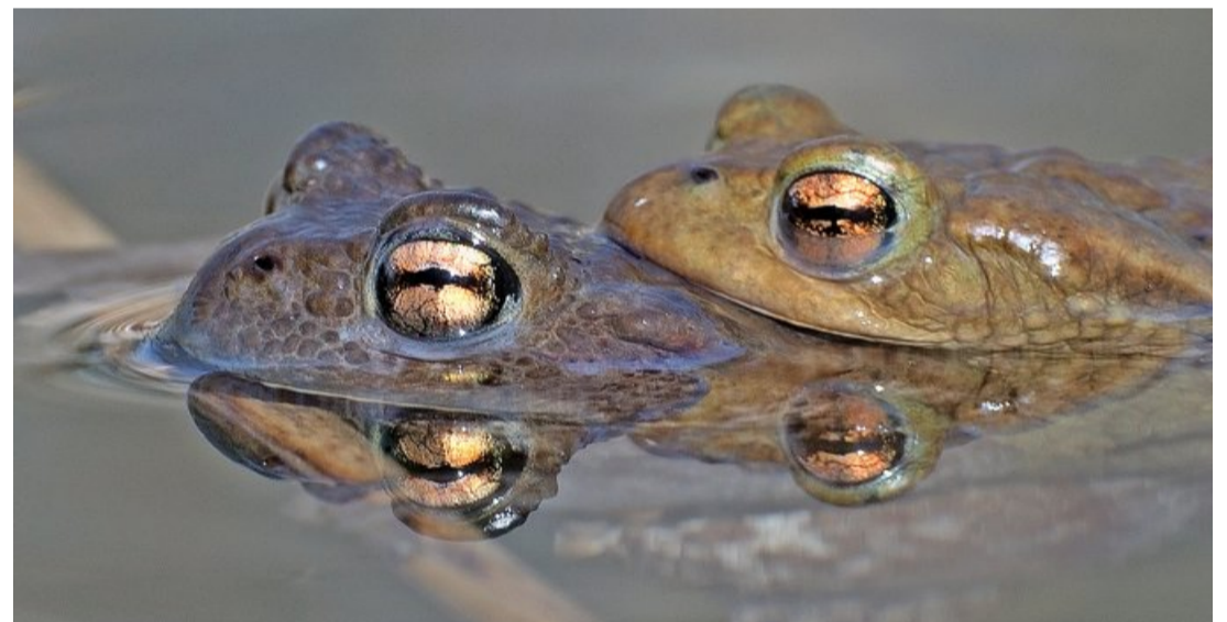
Noch laichen in geeigneten Kleingewässern Erdkröten, bei denen das rotgoldene Auge auffällt.