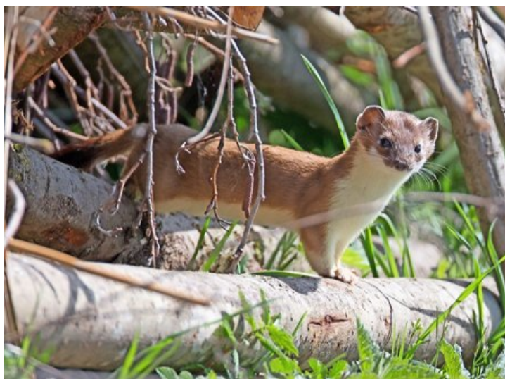
Die Hermeline haben ihr Winterfell gegen das Sommerfell getauscht.