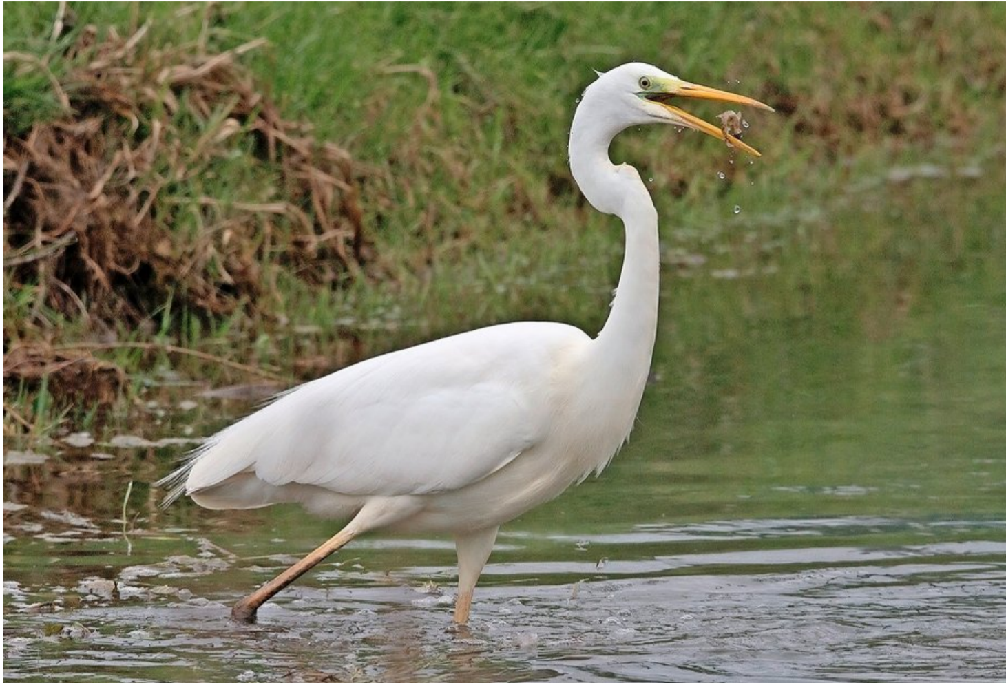
Silberreiher verweilen seit einiger Zeit ganzjährig in der Linthebene und am Obersee. Dieser hier hat gerade eine Schmerle erbeutet.