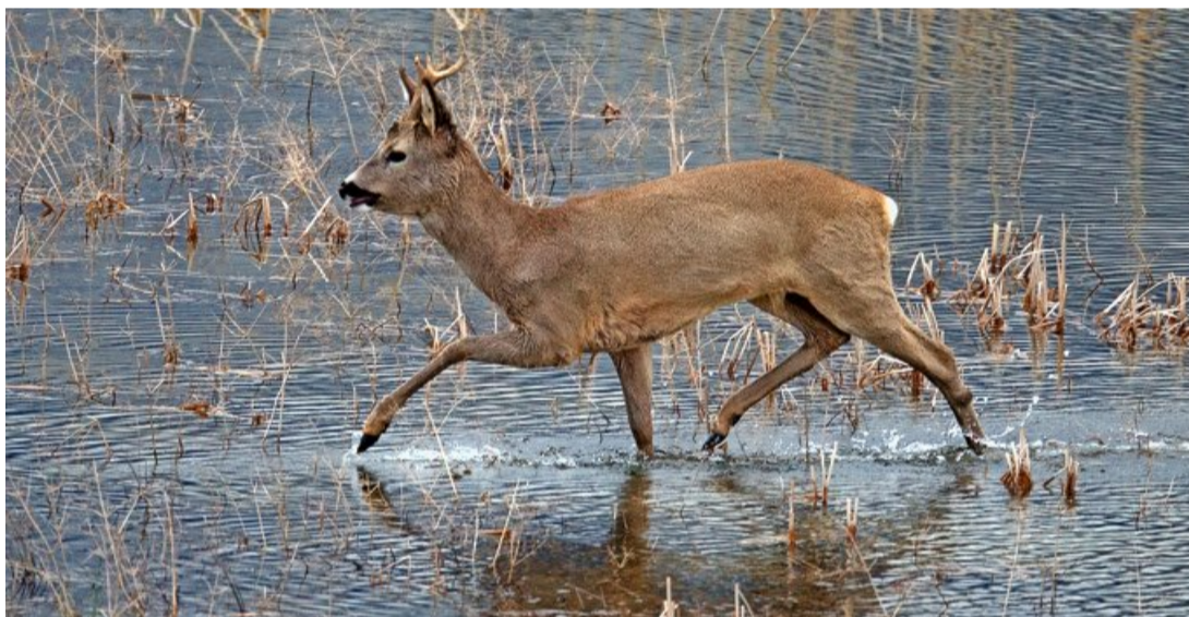
Nach dem Einstau des Kaltbrunner Riets wadet ein Rehbock durch den Flachteich.

NATUR Im Kaltbrunner Riet kehrt wieder Leben ein: Im Frühling wagen sich die Tiere aus ihrem Winterversteck heraus. Wildtierbiologe Klaus Robin hat sich für die ZSZ auf die Lauer gelegt.