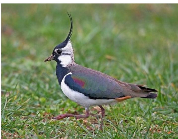
Die grossen Kiebitzschwärme sind nach Nordosten gezogen.