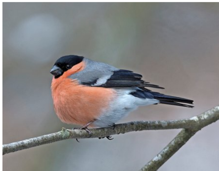
Wo sich Blüten des Schwarzdorns entwickeln, naschen die Gimpel.