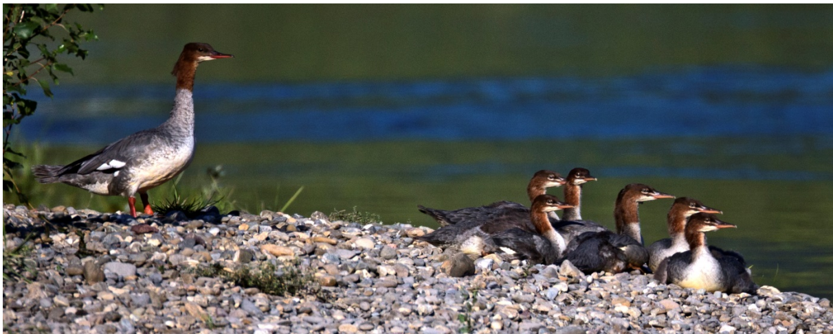
Abb. 7: GÄS-W mit 7 pulli 6/8 Hänggelgiessen, Schänis. 01.07.2015