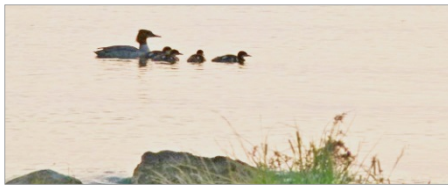
Abb. 6: GÄS W mit 4 pulli 4/8; 03.07.2015; Mündung Linthkanal in den Obersee; Schmerikon