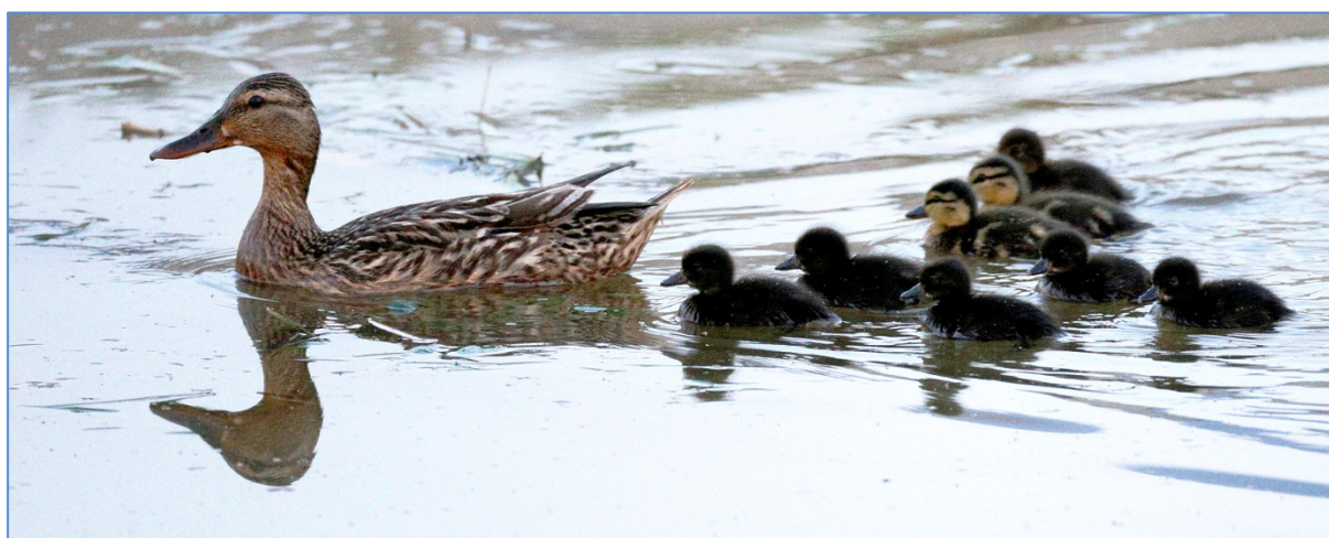
Abb. 5: Mischfamilie. STE-W mit 2 eigenen pulli und 6 REE pulli. 02.07.2015. Sektor 1 Nebengraben. Uznach SG