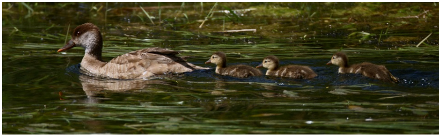
Abb. 1: KOE-W mit 3 arteigenen pulli. 26.07.2015. Sektor 2. Grinau SZ