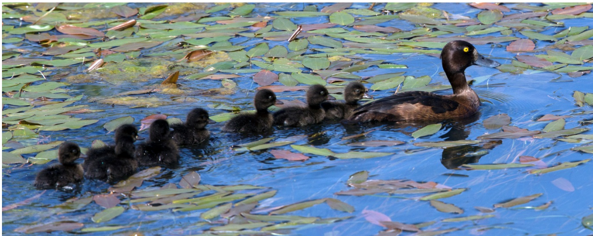
Abb. 4: Grösste Familie 2015 - REE-W mit 8 arteigenen pulli. 11.07.2015. Sektor 1. Nebengraben