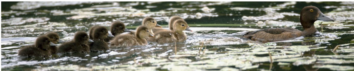
Abb. 2: REE-W führt KOE-REE Mischfamilie. 25.07.2015. Sektor 2. Grinau SZ