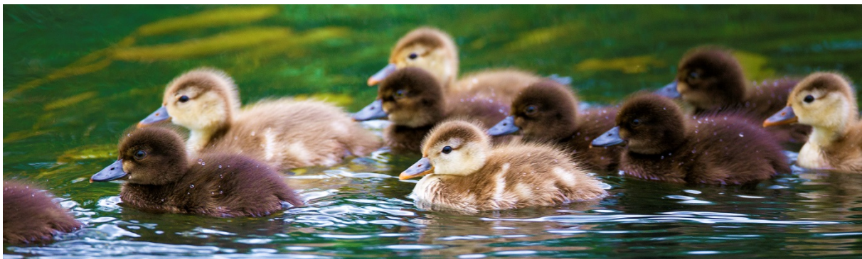
Abb. 3: KOE-REE Mischfamilie; Detail. 25.07.2015. Sektor 2. Grinau SZ